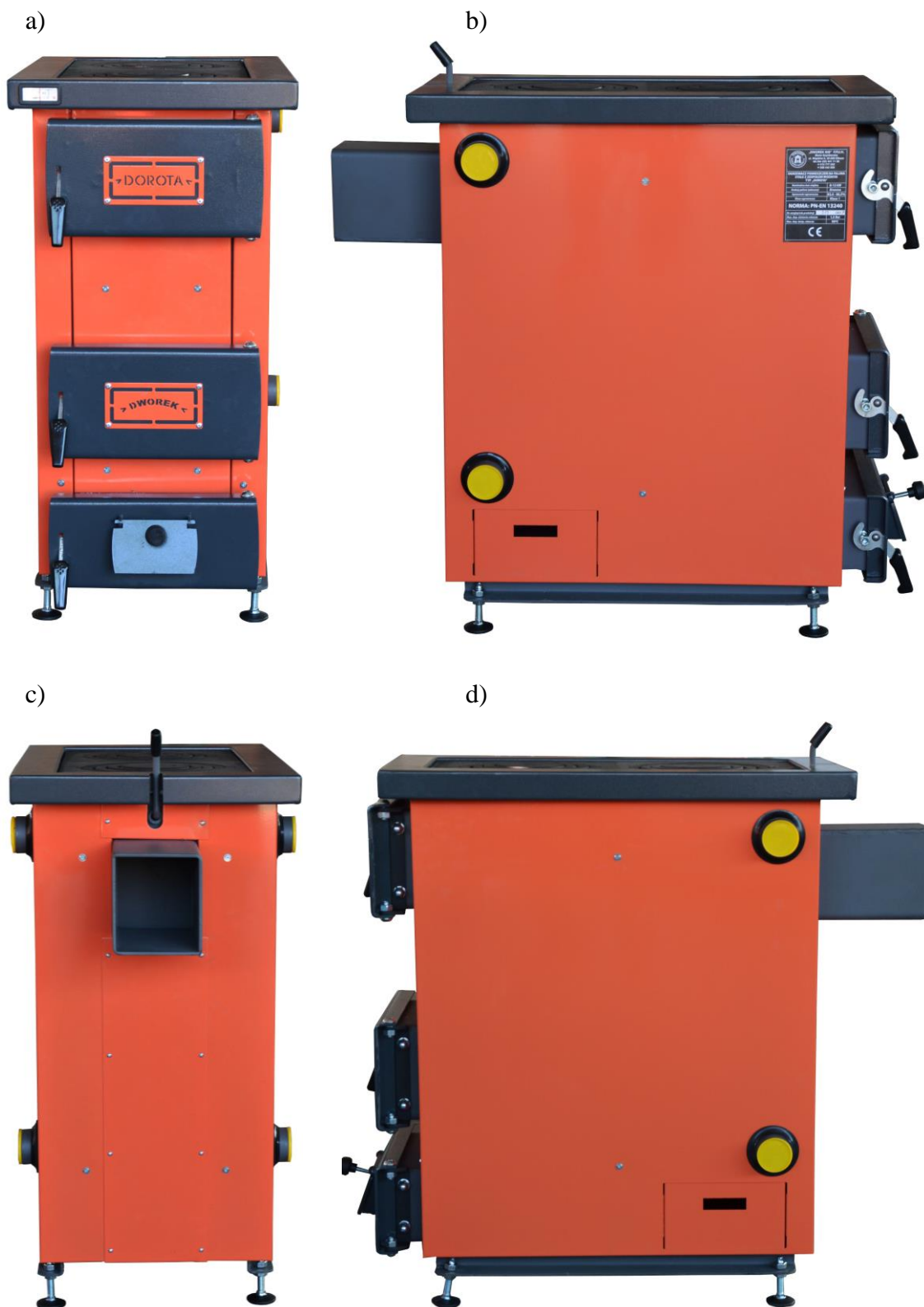
Rys. 1. Ogrzewacz pomieszczeń na paliwa stałe typu „DOROTA”, gdzie: a) widok z przodu, b) widok z lewej strony, c) widok z tyłu, d) widok z prawej strony

Ogrzewacze pomieszczeń na paliwa stałe typu „DOROTA” przeznaczone są wyłącznie do montażu w wodnych instalacjach centralnego ogrzewania systemu otwartego z grawitacyjnym lub wymuszonym obiegiem wody, zabezpieczonego zgodnie z obowiązującymi przepisami krajowymi.