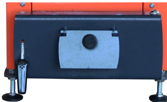
Rys. 2. Stopka regulacyjna, służąca do wypoziomowania ogrzewacza pomieszczeń „DOROTA”

Fundament do posadowienia ogrzewacza powinien być twardy, równy i suchy. Podłoże wykonane z materiałów niepalnych. Stopki regulacyjne, będące na wyposażeniu ogrzewacza, pozwalają w razie konieczności na jego wypoziomowanie (patrz rys. 2).