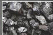
Węgiel kamienny typ 31.2 sortyment groszek o granulacji 5-25mm (eko-groszek)

* - ze względu na ciągłe usprawnianie i unowocześnianie kotłów wymiary mogą ulec zmianie, w przypadku zastosowania stopki regulacyjnych wymiar zwiększa się od min. 30 mm do ok. max. 60 mm