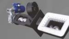
Żeliwny podajnik firmy EKOENERGIA